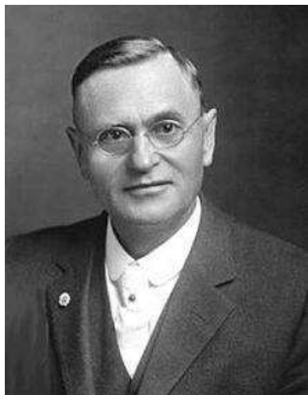
Max Heindel (1865-1919)